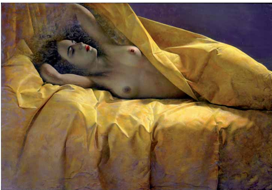
Luz primera. Óleo sobre lienzo de J.F.CÁRCELES